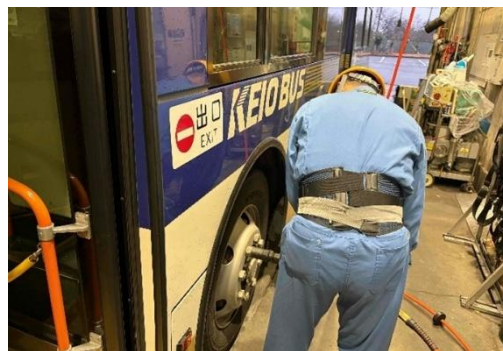
バス整備を行う整備士の装着画像